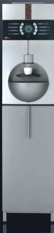
cup cup Solitär