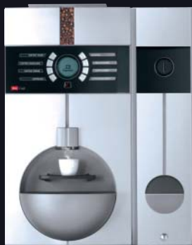
cup cup MW Münzwechsler