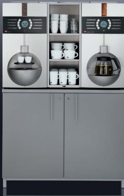
cup + cup CW + cup-breakfast cup Center 1 (Sonderausführung)