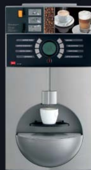
cup MP mit integriertem Münzprüfer