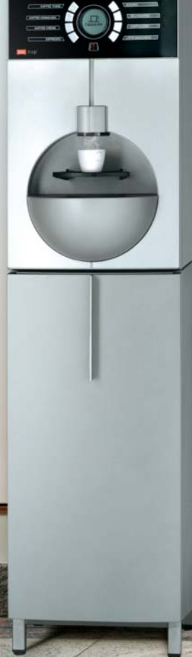
Melitta® cup Solitär