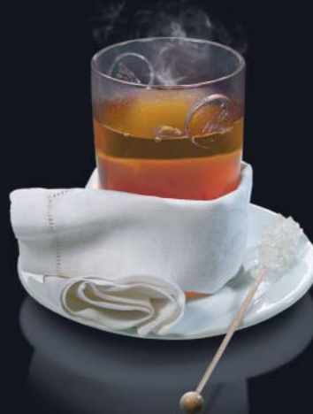
Heißes Wasser für Tee

Espresso oder Kaffee plus Milch. So mögen ihn die Franzosen: ein doppelter Espresso oder Kaffee mit viel heißer Milch.