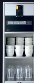
cup CW-MP Tassenwärmer und Münzprüfer