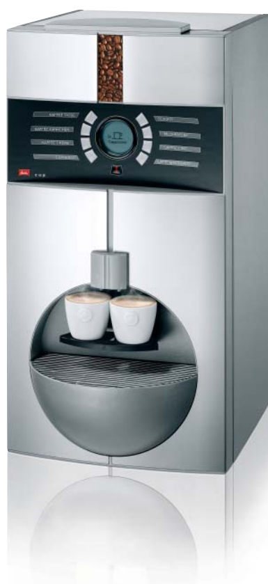
Melitta® cup Ausführung Edelstahl gebürstet