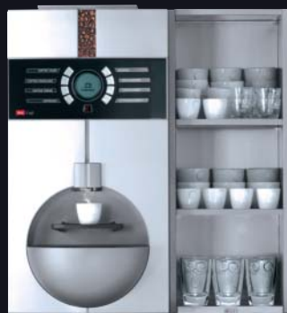
cup cup CW Tassenwärmer